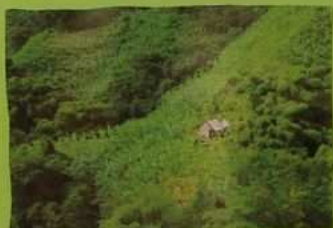
Un champ de Colombie.