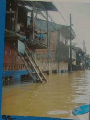
Voici une maison inondée.