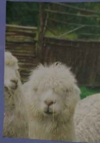
Voici un alpagga à poils longs