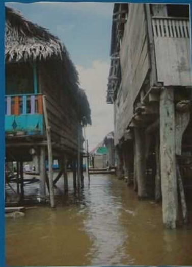
Voici quelques maisons sur pilotis parce que tout est inondé à Iquitos!