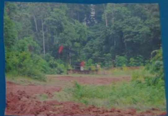
Et là, c'est une pompe à pétrole.