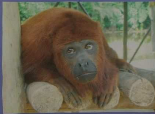
Un autre singe hurleur