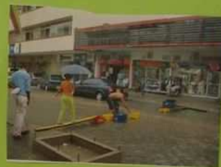
innoculations gemelles supermarchés