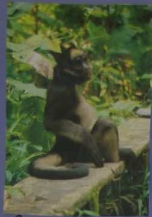
Là c'est un singe handicapé recueilli dans un refuge