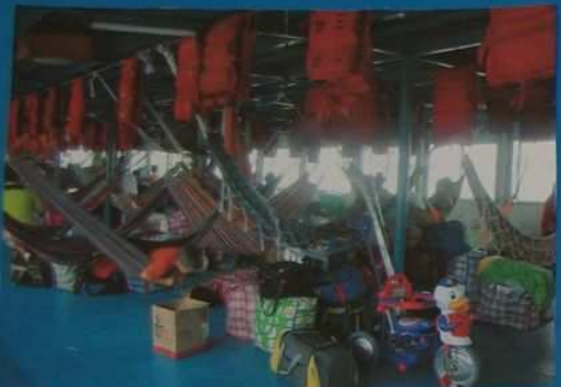
Dans le bateau au dessus il y a des passagers qui dorment dans les hamacs.