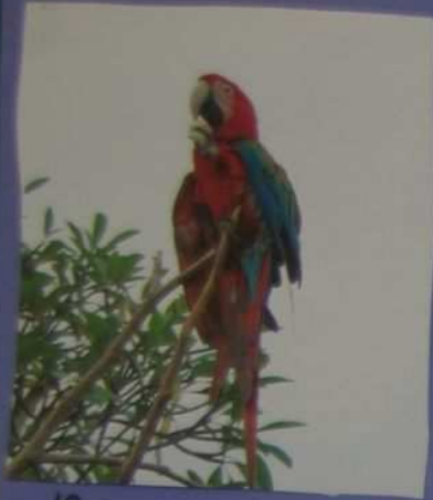
Ceci est un perroquet qui mange du pain.