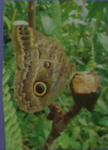
Ici c'est un papillon morpho (avec des ailes bleues) qui mange une figue.