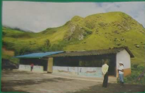
Voici la cour de l'école