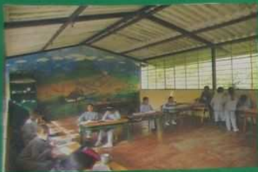
Voilà l'école du village de Gallup.