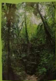
Forêt tropicale d'Amazonie