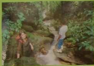
Petit au milieu de la forêt de Colombie.