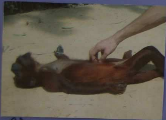
Voici un singe hurleur.