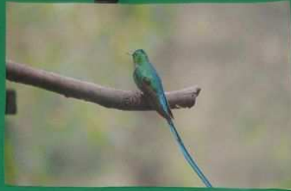
C'est un colibri qui s'est posé sur une branche.