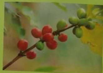
Petit de café avec ses baies rouges.