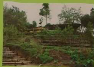
Bâtiments dans la forêt.