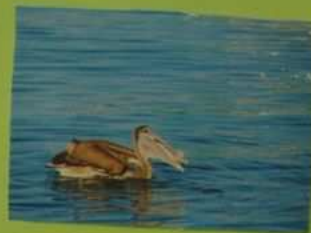
Blairwell avec sa canche.