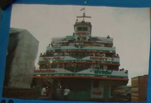
Voici un grand bateau.