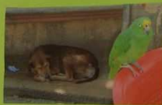
chien et perroquet