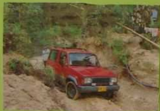
La circulation en train d'être Jeanne et Charlotte qui ne sont accompagnées que de 4 x 4.