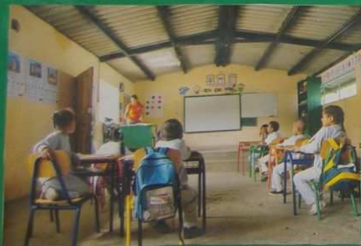
Là c'est la classe de l'école de Gallup.